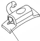
ウェルディングフランジ